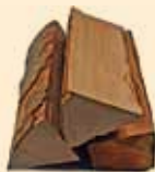
2,5 kg Hartholz