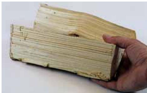
1 kg Fichtenholz

Der richtige Nachlegezeitpunkt ist erreicht, wenn die Glut den Rost gerade noch bedeckt.