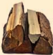
2,5 kg Weichholz