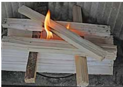
Anordnung von Anzünder, Anzündhölzchen und Holzscheiten für das Anheizen von oben

Prinzipiell gibt es zwei verschiedene Anheizmethoden, die sich in der Anordnung des Anzündmaterials unterscheiden: