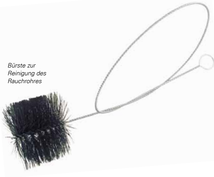
Bürste zur Reinigung des Rauchrohres

Der Schornstein muss deshalb vom Schornsteinfeger regelmäßig gereinigt werden.