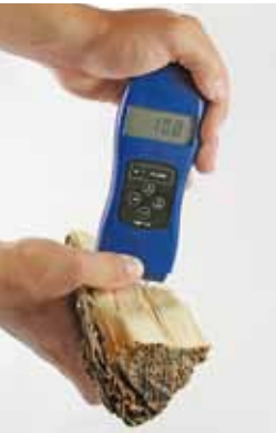
Messung des Wassergehaltes mit einem Schnellbestimmungsgerät

Erntefrisches Holz enthält 50 bis 60 % Wasser. Dessen Verdampfung verbraucht so viel Energie, dass die Temperatur im Feuerraum für eine saubere Verbrennung nicht mehr ausreicht und hohe Schadstoffemissionen die Folge sind. Außerdem kann es zu Feuchteschäden an Ihrem Schornstein kommen. Der Wassergehalt von Brennholz für den Einsatz in Kaminöfen darf 20 % nicht überschreiten. Dies entspricht einem Feuchtegehalt (das heißt Wasseranteil bezogen auf die Trockenmasse) von 25 % gemäß 1. Bundes-Immissionsschutzverordnung. Erntefrisches Holz muss deshalb vor dem Einsatz ein bis zwei Jahre (je nach Eignung des Lagerstandortes) getrocknet werden.