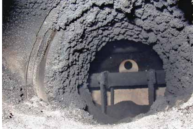
Rußablagerungen im Rauchrohr behindern den Abtransport der Abgase.

Die Reinigungsintervalle werden bei der sogenannten Feuerstättenschau, die alle drei bis vier Jahre durchgeführt wird, vom Bezirksschornsteinfegermeister im Feuerstättenbescheid festgelegt. Die Intervalle richten sich nach der Kehr- und Überprüfungsordnung und liegen je nach Benutzungshäufigkeit der Feuerung zwischen einmal und viermal jährlich.